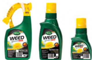
SUPPRESSION DES INFESTATIONS

Pour empêcher les affreuses mauvaises herbes d'enlaidir votre pelouse, utilisez Scotts® Weed B Gon® Max pour tuer les mauvaises herbes, pas la pelouse MC . Il supprime efficacement les mauvaises herbes à feuilles larges de la pelouse, comme le pissenlit, la céréaiste vulgaire et le trèfle blanc qui apparaissent pendant la saison. Il est offert en format prêt à l'emploi pour une suppression localisée et en format concentré pour supprimer les infestations. Pour des résultats optimaux, arrosez chaque mauvaise herbe tout juste au point de ruissellement. Une deuxième application peut être nécessaire.