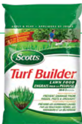
FORMULE TOUT USAGE