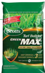
FORMULE À TENEUR ÉLEVÉE EN FER