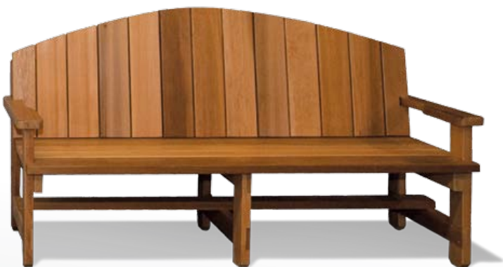
Objets fabriqués par les participants de l'Atelier de fabrication RONA par Tradeworks à Vancouver.