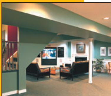
étape par étape